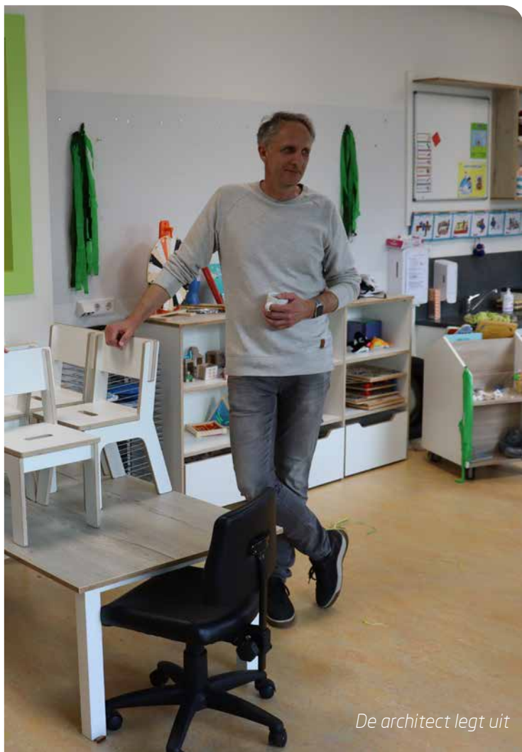
De architect legt uit

Bewegen moet weer onderdeel uit gaan maken van de normale dingen die kinderen graag doen. In de 'beweegschool' kunnen kinderen hun eigen uitdaging aangaan en grenzen verkennen. Topos heeft voor Integraal Kindcentrum De Twijn een uniek concept ontwikkeld wat bewegen weer terugbrengt in de natuur van het kind. Zowel cognitieve als motorische vaardigheden kunnen hiermee worden verbeterd. De opgave kinderen meer te laten bewegen wordt daarmee niet teruggelegd naar de leerkrachten maar naar de plek waar het hoort...bij de kinderen zelf.