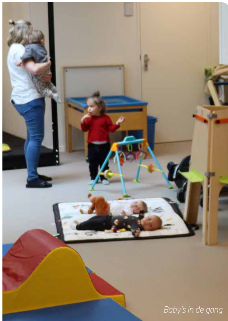
Baby's in de gang

Het uitdagende onderwijs, BSO en kinderopvang onder één dak. Pedagogisch medewerk(st)ers, leerkrachten en directie vormen één team met één gezicht. Op deze manier is er een brede expertise op het gebied van de ontwikkeling van een kind in een omgeving waarbinnen alle kinderen het stralende middelpunt zijn! Door alle overgangen vloeiend te laten verlopen geven wij kinderen de kans hun talenten optimaal te ontwikkelen.